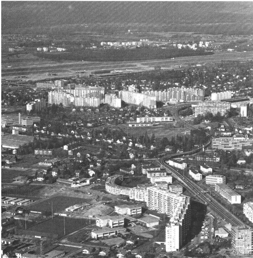
Extensions urbaines: au premier plan, Châtelaine-Aïre; au deuxième plan, la cité des Avanchets; à l'arrière-plan, l'extension de Ferney en France voisine. 1976.

Devant la difficulté de trouver des terrains disponibles vastes et bon marché en périphérie, ainsi que face à l'évolution qualitative de la demande de logements, on peut considérer que la cité des Avanchets (non terminée) est le dernier exemple de grand ensemble dans le canton, alors que d'autres projets semblables étaient encore prévus.