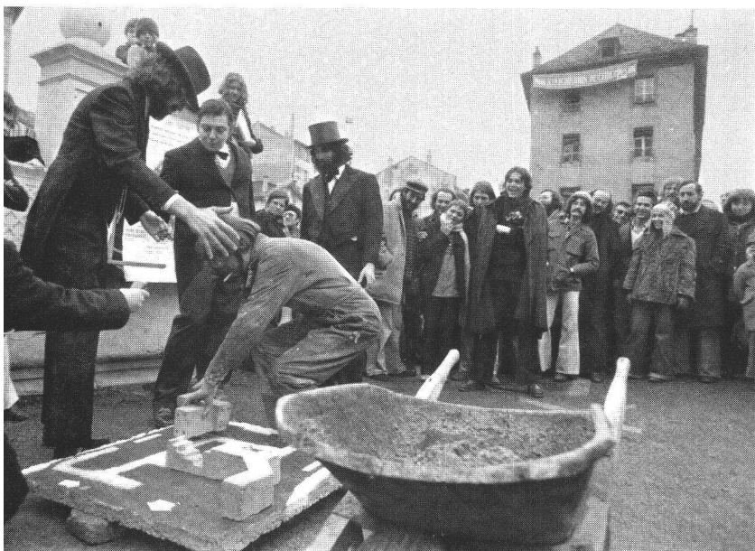
Lutte contre les démolitions: le mouvement des habitants du quartier des Grottes scelle dans la chaussée la maquette du futur quartier, au cours d'une grande manifestation-fête un jour de semaine à midi, 1976.

vent à l'expulsion des locataires qui ne peuvent assumer ces augmentations.