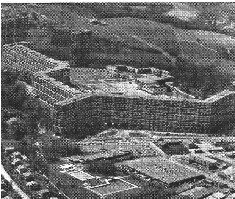
Extensions urbaines: la cité du Lignon. 1971.

Ces lois permettent l'apparition de grands ensembles périphériques tels que le quartier des tours de Carouge (1958-1963), le Lignon (1964-1971), la Gradelle (1963-1967), les Avanchets (dès 1970) et la création de cités satellites comme Meyrin (dès 1961) et Lancy-Onex (dès 1961). Ces réalisations sont rendues possibles par des déclassements de zones de terrains agricoles en zones d'expansion.