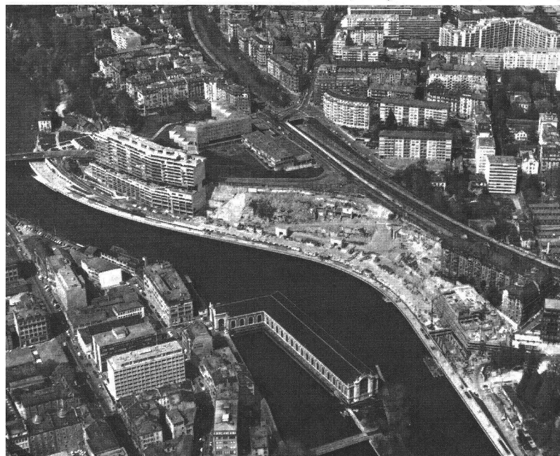
Rénovation urbaine: le quai du Seujet 1976.

D'autres projets touchent le quartier de la Terrassière, la gare des Eaux-Vives, etc.