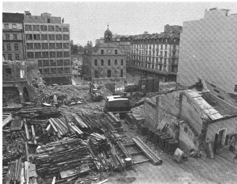
Rénovation urbaine: le «trou de Confédération-Cité» 1977.

soixante, a marqué la spécialisation en bureaux des quartiers traditionnels d'habitation.