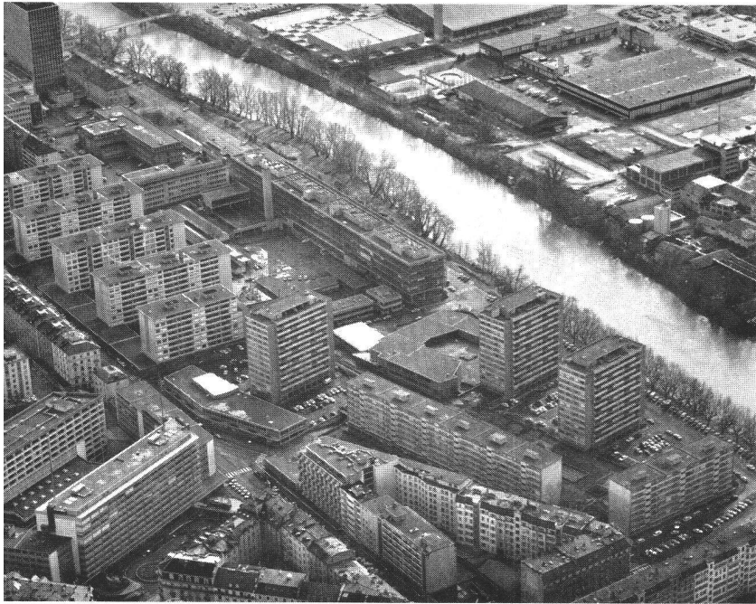
Rénovation urbaine: au premier plan, l'immeuble de l'administration cantonale et la cité Jonction; au deuxième plan, l'extension de l'Université le long du quai de l'Ecole-de-Médecine; au fond, la zone sportive et industrielle des Vernets.

tant que moyen de relance économique, face à l'arrêt de la construction et à la récession. En effet, la modernisation ou la transformation d'immeubles font appel à une main-d'œuvre plus importante que la construction neuve, et assurent plus de travail aux entreprises du second œuvre et aux entrepreneurs et artisans locaux.