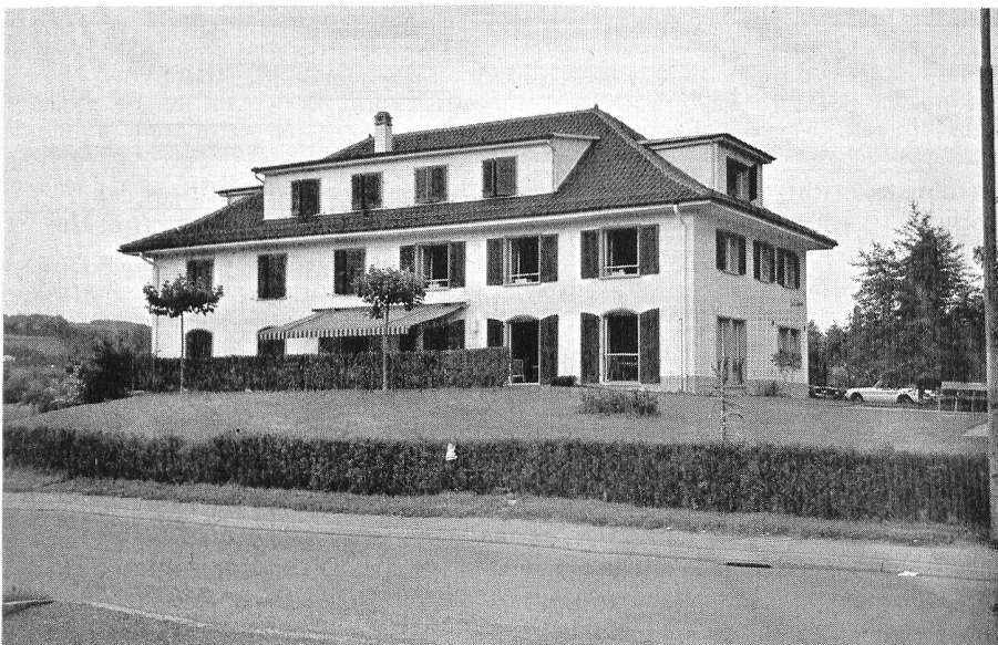
La Châtelaine à Moudon: vue d'ensemble du bâtiment.

Mais ce que l'on a pu voir, lors de la dixième assemblée générale de la société, c'est le résultat: la salle communale de Moudon mise à disposition par les autorités avait été entièrement décorée par les pensionnaires de la Châtelaine, et c'était magnifique: des fleurs en papier partout, des fleurs multico-