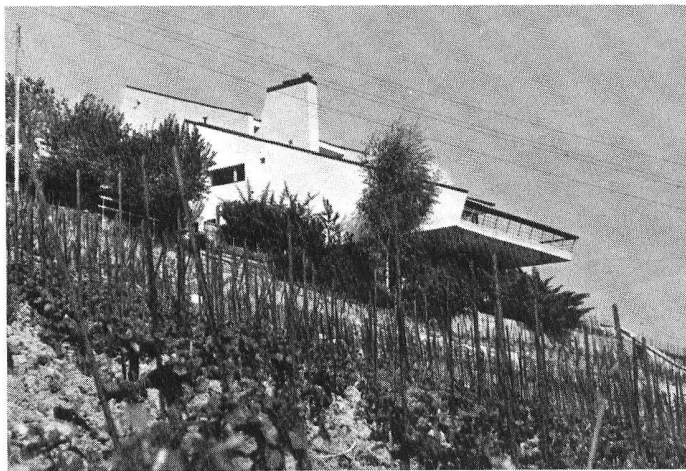
Dans le paysage autochtone, l'espace urbanisé rappelle aux membres du groupe une situation passée difficile de l'activité locale.