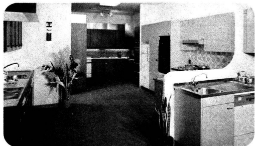
● votre cuisine

1211 Genève Grand-Pré 33-35, Tél. 022/34 80 50 1000 Lausanne Rue des Terreux 21, Tél. 021/20 32 11 1800 Vevey Rue St-Antoine 7, Tél. 021/51 05 31 1860 Aigle Route d'Evian, Tél. 025/2 36 23 1837 Château-d'Oex Le Pré, Tél. 029/4 75 75 1400 Yverdon Rue des Uttings 29, Tél. 024/25 81 91 1951 Sion Rue de la Dixence 33, Tél. 027/22 89 31 3930 Viège Lonzastrasse, Tél. 028/48 11 41