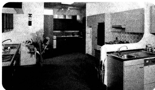
● votre cuisine