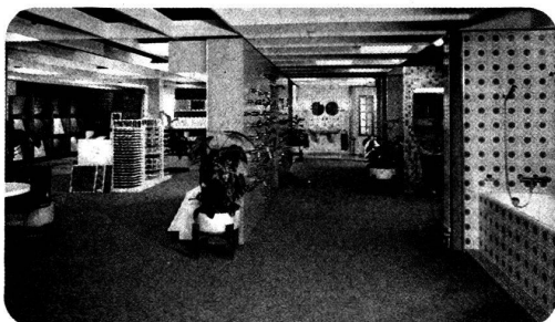
● votre salle de bains ● vos carrelages