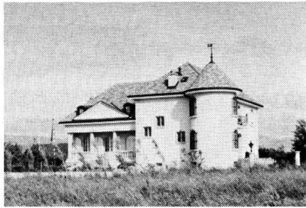
L'extension des «zones villas» rêve ou cauchemar?

tes difficultés – problèmes du logement, des moyens de transport, des équipements multiples – il est constamment aux prises avec cet univers urbain multiforme. Il est donc étonnant de constater l'ampleur de la démission du citoyen à l'égard des affaires publiques qui régissent son mode de vie hors travail.