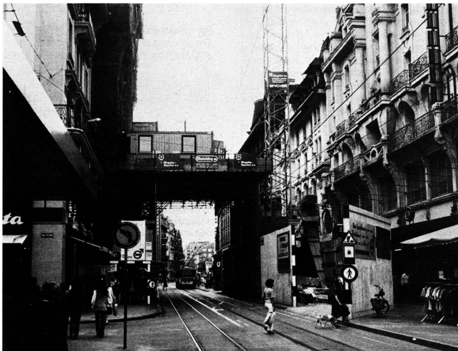
Un environnement urbain multiforme.

Lorsque l'on considère les menées de certains acteurs privilégiés du monde urbain, on ne peut que constater l'émergence d'éléments de réflexion et de conflits qu'ils suscitent. Les groupes économiques – banques, promoteurs, etc. – investissent et transforment la ville selon leurs intérêts particuliers. Les partis politiques s'emparent de ce nouveau motif de polémique, attaquant ou défendant les enjeux économiques résultant des mutations urbaines. Les comités de défense ou de quartier dénoncent les carences plus ou moins importantes en matière d'urbanisme. Les médias locaux se passionnent pour le thème urbain et amplifient les débats soulevés par la qualité de la vie, l'écologie, le problème des équipements collectifs,... Ces divers intervenants aux intérêts souvent contradictoires inscrivent l'urbanisme pris dans sa conception la plus large dans la réalité consciente, omniprésente et quotidienne de tout individu. D'autre part, du fait que le citoyen est en butte à main-