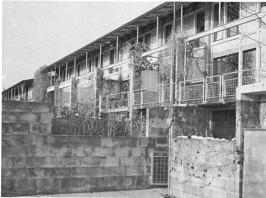
«Bleiche», à Worb BE. Arch. Oswald.