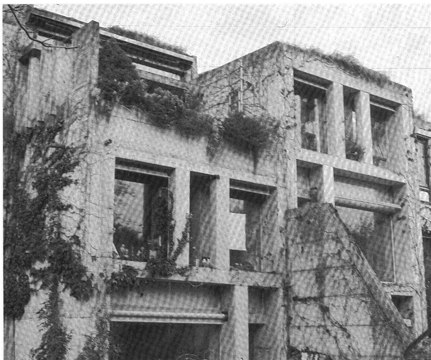
«Talmatt», près de Berne, Arch. Atelier 5.