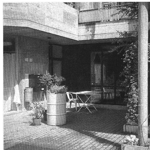
«Hintere Aumatt», à Hinterkappelen BE. Arch. Aellen.

Cette pénurie sévit dans la plupart des pays occidentaux. Les raisons de cette situation: la montée des «ménages d'une personne». Dans certaines villes américaines, à Berlin, à Paris, ils ont dépassé la barre des 50%. A Genève, on en dénombre 40%. Dernières arrivées sur le marché du logement, les «familles nucléaires» (couples avec enfants) ne trouvent à louer que des appartements chers et trop étroits. Vieillesse de la population, divorce, «studiomanie» des jeunes, tels sont les paramètres actuels en matière de logement.