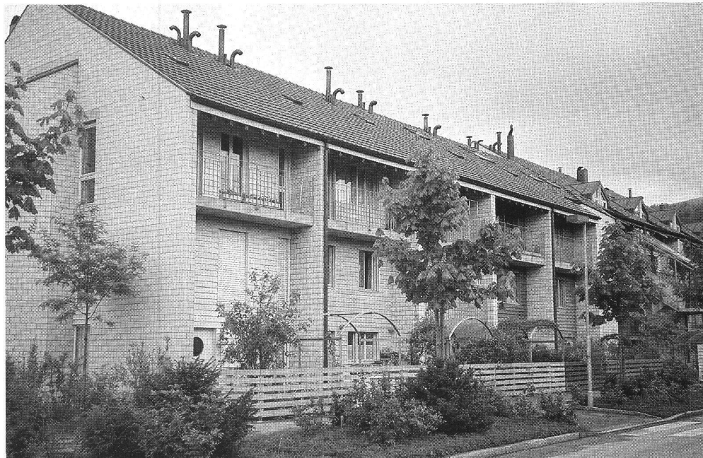
«Chemin-Vert», à Bienne. Arch. Mollet.

Office fédéral du logement Case postale 38 3000 Berne 15 Téléphone (031) 61 24 44