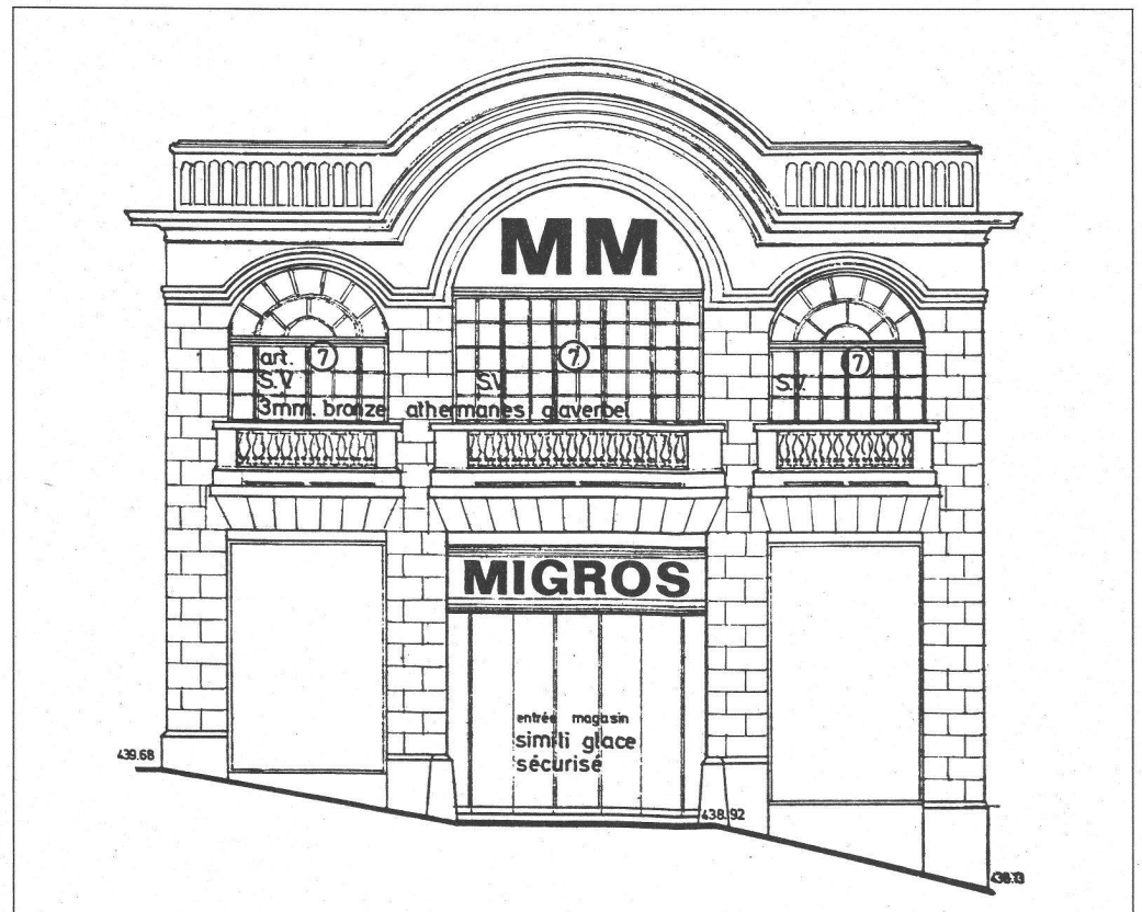
MM. Migros, 1976. Entrée principale. Architectes Adatte et Juvet.

En 1976, la maison Migros mandatait un bureau d'architectes pour transformer ce garage en supermarché MM. Le propriétaire, sur les conseils des services communaux et cantonaux pour la protection des monuments historiques, s'engageait à respecter les façades, les ouvertures et les verrières du bâtiment.