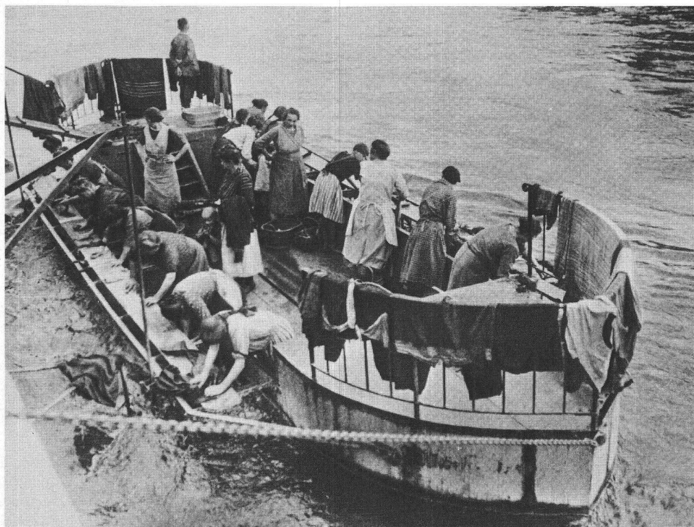
Bateau-lavoir à Würzburg. (Tiré du livre de Fred Bertrich, Kulturgeschichte des Waschens , Düsseldorf, Econ, 1966.)

«Si la lessive elle-même ne mobilisait pas un espace permanent, le linge sale, au contraire (encombrant car les lessives étaient rares), occupait une place spécifique, dans un lieu aéré et cependant à l'écart de l'habitation elle-même, généralement grenier ou bûcher.»