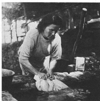
Le «bon» vieux temps.

«Linge, Lessive, Labeur», tel était le titre de l'exposition abritée cet été par le Musée Neuhaus à Bienne. Habitation l'a visitée en compagnie d'écoliers de 10-11 ans. Documents, photos, instruments et objets d'époque, vidéo et décors racontaient la dure besogne des femmes. Et l'isolement «progrès... sif» de la ménagère dans notre société.