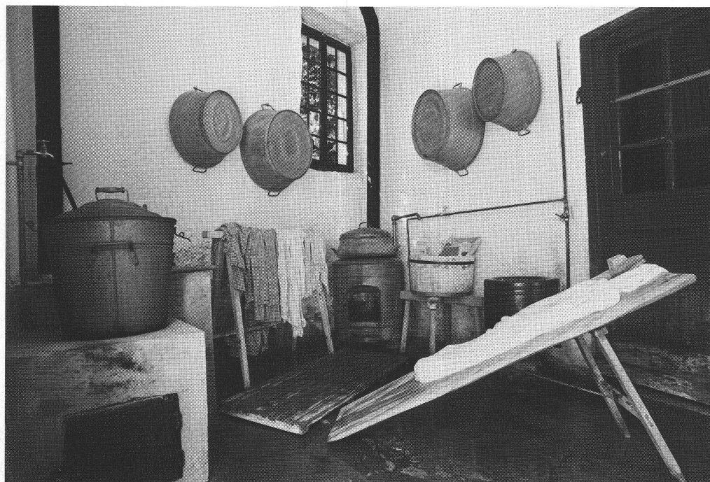
La buanderie d'autrefois.