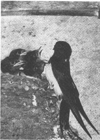
Hirondelles de cheminée.

Chaque maison et chaque jardin pourrait accueillir un coin de nature sauvage.