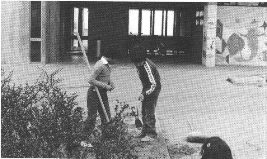
Les enfants ont besoin du contact avec la terre.

Victimes de l'«artificialisation» des cultures, les oiseaux des campagnes se raréfient. Pinsons, verdiers, chardonnerets, rouges-queues noirs, mésanges charbonnières,