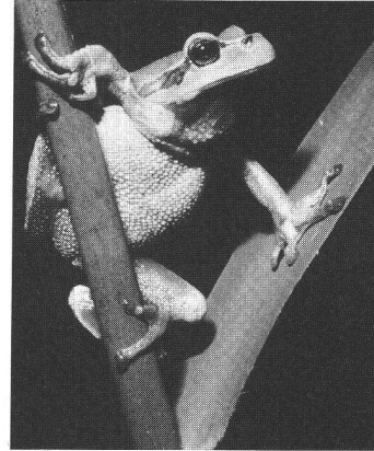
La reinette verte, en voie de disparition, retrouve des conditions de survie dans les biotopes citadins.

Il a été fait abondamment, dans la presse romande, par l'Office fédéral de la protection de l'environnement. Les chefs d'accusation: il représente 20 000 hectares du territoire cultivable, engloutit 100 tonnes d'herbicides et 10 000 à 16 000 tonnes d'engrais, mobilise des milliers de tondeuses bruyan-