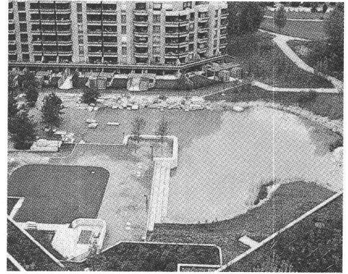
Un essai d'aménagement plus naturel.

L'adaptation des oiseaux au milieu urbain va si loin que, hirondelles de cheminées,