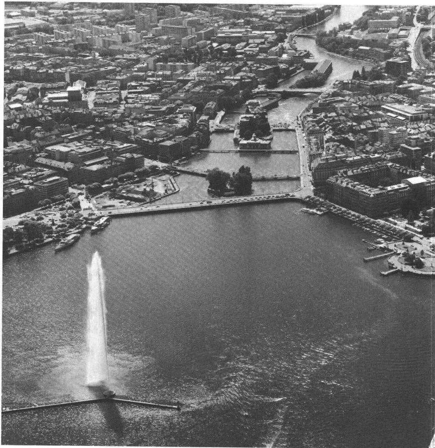
Vue aérienne de la rade et du Rhône.