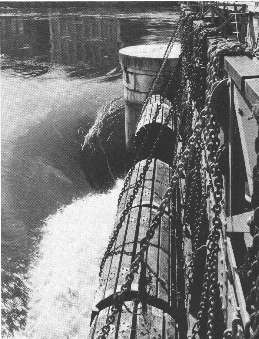
Barrage à rideaux, système Caméré, du pont de la Machine, installé dans le bras droit du Rhône en 1887. Il permet de régler le niveau des eaux du lac selon la Convention intercantonale de 1884.

La deuxième étape, au temps où Genève devenue République devait préserver son indépendance, est de nature essentiellement militaire. Elle se révèle extrêmement violente par l'importance des projets d'emprise sur le plan d'eau, la plupart heureusement non exécutés. L'exploitation du lac et du Rhône à l'intérieur du réduit de la ville passa par une crise, où s'affrontèrent les besoins de la nouvelle installation de pompage hydraulique, de l'industrie, de la salubrité, et ceux du dégagement du courant et de la régularisation du niveau du Léman. Ces exigences contradictoires entraînèrent jusqu'au milieu du XIX e siècle une rationalisation progressive dans la gestion du plan d'eau et un équilibre subtil des emprises, commandé par l'intérêt économique et les notions d'embellissement de l'espace public. La plus grande opération de comble-