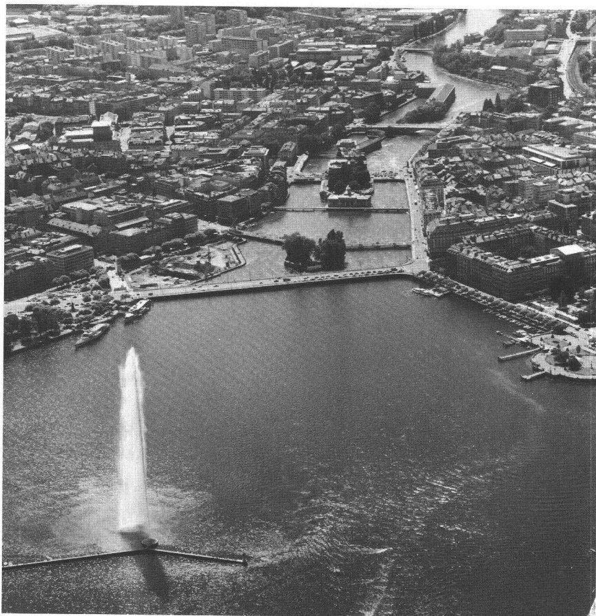
Vue aérienne de la rade et du Rhône.