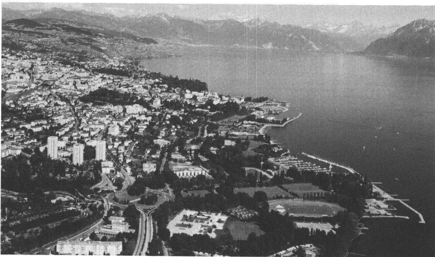
Lausanne – vue générale.