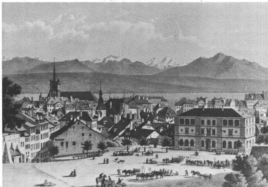
Lausanne, avec au premier plan la place de la Riponne et au second plan l'église Saint-François. Dessiné d'après nature et gravé sur acier par F. Martens, vers 1850.

Le préalable à toute renaissance d'un idéal régional tient donc dans un changement de climat politique. Celui-ci ne peut se produi-