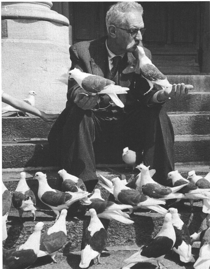
Emouvant, le spectacle de la personne âgée partageant son pain avec ses amis pigeons.

Depuis les années 50, les villes ont changé. Beaucoup d'oiseaux les ont quittées, d'autres se sont adaptés: moineaux, merles et