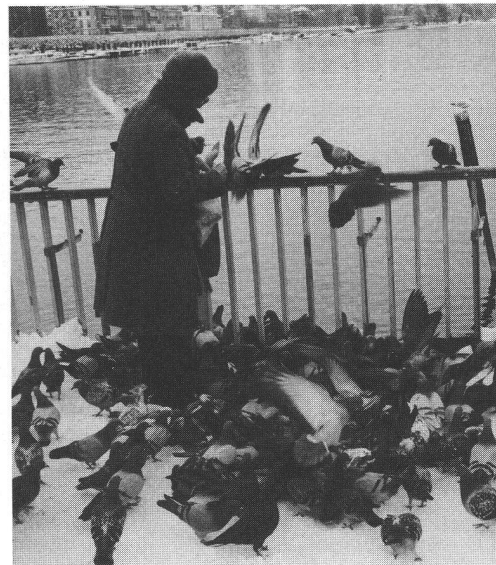
Des personnes bien intentionnées se font un devoir de les nourrir douze mois sur douze.

Mais trop, c'est trop. Un millier de ces gracieux volatiles «arrosent» la cité d'environ dix tonnes (par an) de guano... Des mesures intelligentes ont diminué de moitié le nombre des pigeons à Genève et à Lausanne, pour ne citer que ces deux villes.