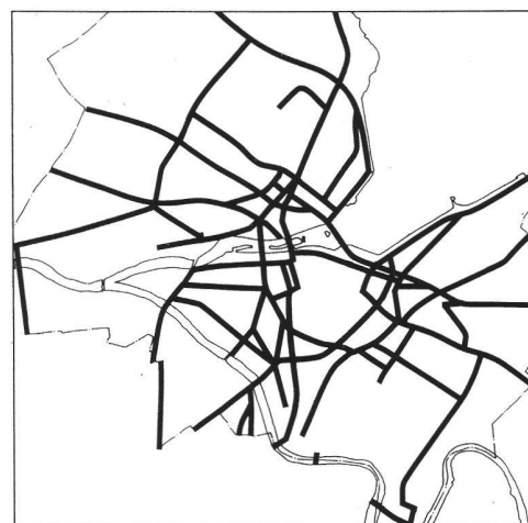
c. en 1984

(Sources : archives du Service d'urbanisme de la Ville de Genève, cartes rétablies par Ph. Gfeller. Voir Le bruit dans la ville , op. cit., p. 52.)