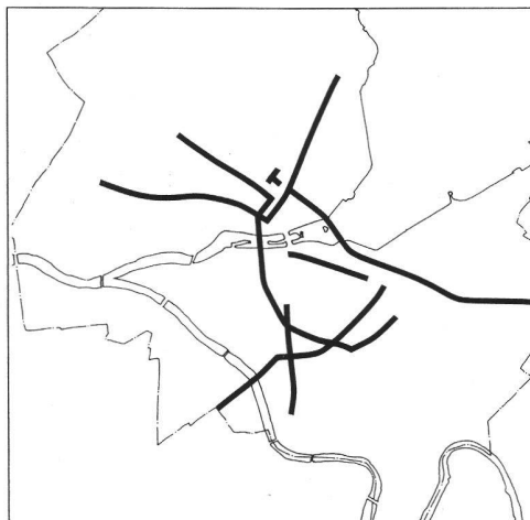
a. en 1957