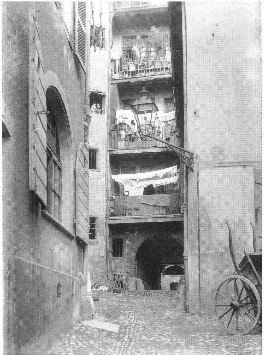
Figure 1 : Genève, étendage du linge, à l'allée du Sel, quartier du Seujet, vers 1900.