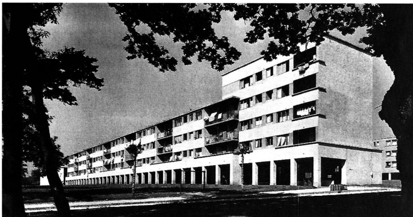
Cité Vieusseux : vue du groupe A dessus) et du portique (ci-dessous).