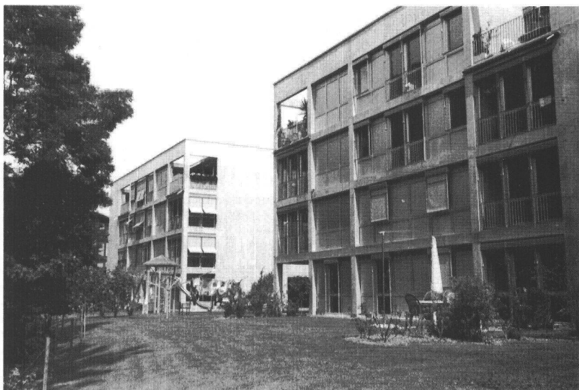
Le sud côté jardin

Si on donnait un pinceau aux habitants des Toises ils se mettraient sans doute à peindre les façades des bâtiments. Le gris du béton, le dépouillement de l'architecture, voulus par Nicolas Delachaux et Bernard Boujol, les architectes nyonnois auteurs du projet, les dérangent. Ce qui ne les empêche pas d'être heureux, très heureux même, dans l'espace conçu pour eux. Paradoxalement leurs propos montrent qu'ils sont en harmonie avec l'architecture critiquée. Car, comme l'explique Bernard Boujol: « L'épine dorsale du projet c'est la communi-