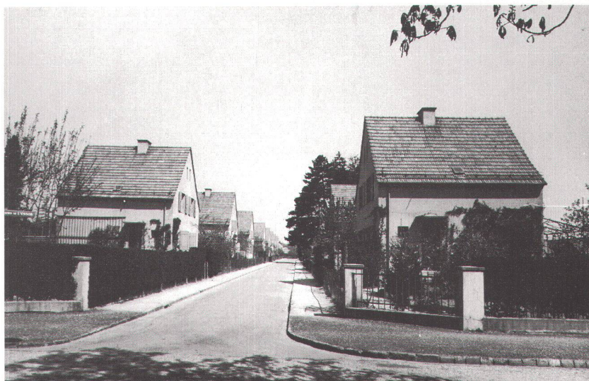
Chemin de l'Essor

Malgré son urgence, le logement ouvrier intéresse peu de monde excepté les philanthropes et des chefs d'entreprises. Pour les premiers, il s'agit d'un engagement essentiellement moral contre les abus d'une société qui spéculé sur ses pauvres et «loue cher des logements insalubres» 2 . Ce sont des philanthropes qui lancent en 1851 un concours public «afin d'établir le meilleur plan d'habitation pour des familles d'ouvriers». Des huit projets rendus, on retiendra celui qui apparaît comme le meilleur pour ériger à Cornavin une maison dite «des petites familles». D'autres projets intéressants verront le jour jusqu'à la constitution, à la fin du XIX e siècle, de la Société genevoise des logements hygiéniques qui construira, notamment rue Caroline, des bâtiments à quatre appartements par palier. En 1903, suivant une typologie mieux étudiée, seront construites les maisons ouvrières du quartier des Grottes. En clair, bien peu de choses face à la dimension des besoins des familles populaires, de loin les plus nombreuses. En 1900, Genève compte trois associa-