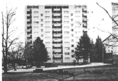
Fribourg, route du Jura 22-32 Maître de l'ouvrage : Société coopérative La Solidarité