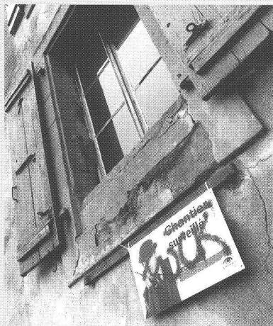
Vue plongeante sur le Désert. Il faut faire quelque chose. Mais quoi ?