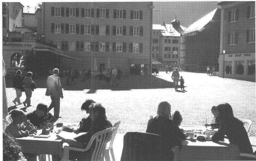
Vue sur Perrigplatz

Le concours était un concours modeste dans ses ambitions, puisqu'il y avait somme toute peu à re-composer, mais la réflexion qu'il entendait susciter s'avérait en revanche plus fondamentale: la question rituelle du «tout-piéton» se posait en effet une fois de plus et, cette fois-ci, l'échelle semblait bonne. 5