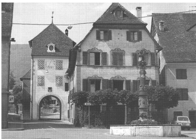
La Porte-au-Loup à Delémont

Quant au logement social, Delémont dispose d'une longue tradition, un peu oubliée avec le temps, mais réactivée à