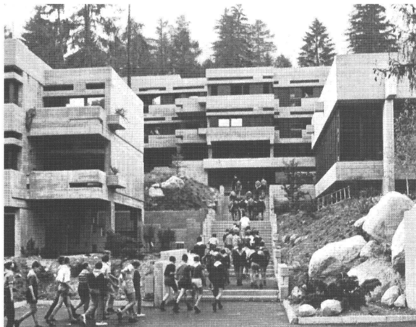
Le village de vacances de Fiesch

architecture de Paul Morisod n'est pas tirée de quelque médiocre leçon de modernisme. Elle s'inscrit dans le Vieux-Pays comme l'annonce d'une vie meilleure. Cette plaine du Rhône aux multiples vallées latérales est le cadre où Paul Morisod a édifié une architecture marquée de cette empreinte forte et rugueuse comme le granit des Alpes mais aussi formulée comme le signe d'une ère nouvelle.