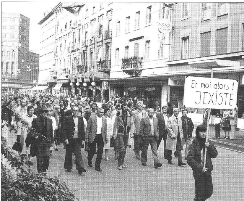
Une manifestation lors de la crise horlogère au début des années 80 : dans cette foule, on comptait de nombreux coopérateurs

Ces composantes confèrent à l'agglomération biennoise une évidente originalité. Des témoins sensibles comme la cité-jardin de Lanz, particulièrement réussie, la Maison du Peuple, mais aussi des réalisations contemporaines, sont autant de preuves en faveur de la procédure choisie. Les résultats tiennent aussi aux hommes qui supportent l'édifice coopératif. Nous leur laissons la parole :