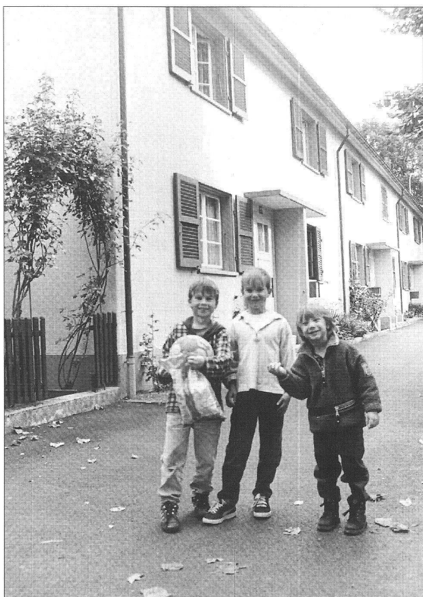
Le décor planté par Eduard Lanz au début des années 20 a bien résisté.