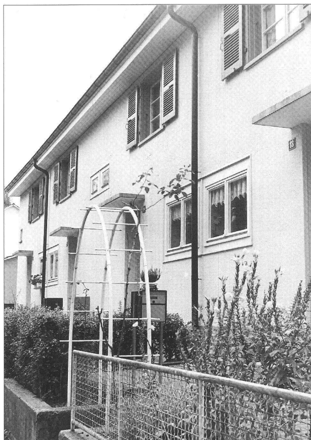
Cette construction de cité-jardin remonte au début des années 30, toujours sous la signature d'Eduard Lanz.

contentés de gérer, rénover, entretenir un parc de petits logements plutôt bon marché, entre 650 et 750 fr le trois-pièces.