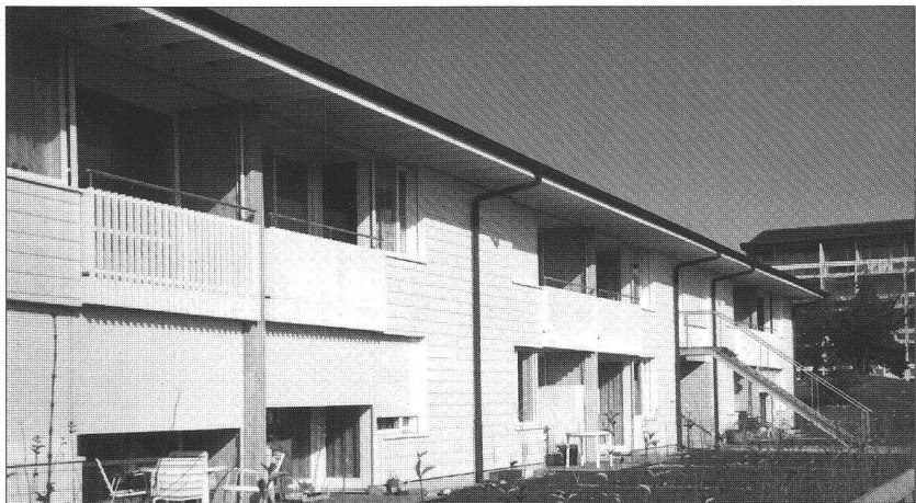
Vue prise, côté sud, des maisons avec jardin. En arrière-plan, l'escalier donne accès au studio de 40 m 2 . Répartis dans les autres pages, vues et plans de ce projet original.