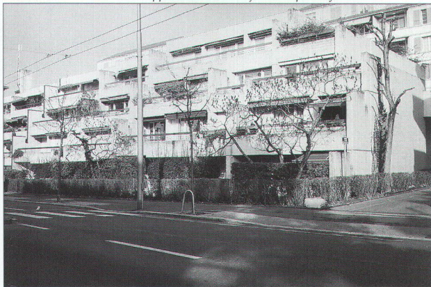
immeuble d'habitation avec appartements rez + jardins «privatifs»