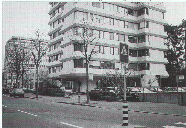
immeuble tour avec bureaux, dégagé de l'alignement, offrant un espace d'accès