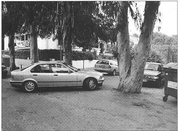
La volonté de préserver les arbres ne va pas sans effort...

nalisme. Mis en application brutalement dans les années 50-60, il marquera à jamais le paysage urbain et péri-urbain. La théorie fonctionnaliste se veut universelle, partant du principe que tous les individus ont les mêmes besoins: travailler, se loger, se nourrir, se récréer; elle est applicable aux quatre coins de la planète.