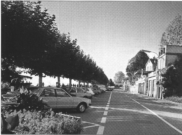
Simplicité, rigueur et beaucoup d'effet... (Vevey)