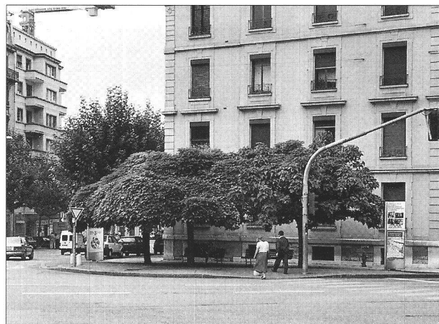
Des arbres et des bancs...un lieu privilégié en ville... (Genève)

Pendant cette même période émergent les théories du mouvement progressiste qui introduisent le fonction-