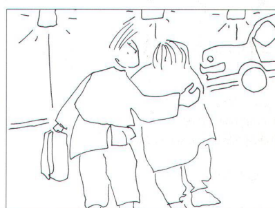
Départ à l'hôpital sur les chapeaux de roue