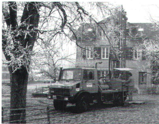
Installation d'une sonde.

Pour des installations de plus grande dimension, l'éventail des solutions est plus large. On peut soit multiplier les forages,