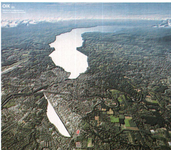
Quelques illustrations du projet lauréat

Publication complète de Palmarès: Revue Tracés no 20, octobre 2005 Site du concours: http://www.fas-geneve2020.ch