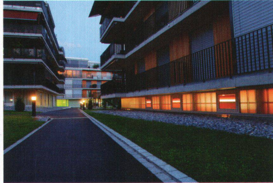
L'Age Award 2005 avait récompensé le projet de la société coopérative ASIG pour son ensemble résidentiel Steinacker à Zurich.

Le but des Age Awards consiste à faire connaître à un large public la multiplicité des types d'habitation existant pour les seniors et c'est la raison pour laquelle la fondation choisit un domaine de concours particulier pour chaque prix. L'Age Award 2003 avait ainsi récompensé le projet de la société coopérative Durachtal à Merishausen, qui a réalisé un modèle d'habitation combinant harmonieusement habitat autonome des personnes âgées avec contacts sociaux, sécurité et prestations de services. Le jury avait notamment particulièrement apprécié le pragmatisme du projet et la forte intégration sociale des habitants de l'immeuble dans la vie du village. L'Age Award 2005 avait récompensé le projet de la société coopérative ASIG pour son ensemble résidentiel Steinacker à Zurich: des appartements dénués de tout obstacle, favorisant la mobilité des personnes âgées, et permettant une utilisation souple des aménagements qui répondent à des besoins d'habitation différenciés. Le jury a particulièrement apprécié le fait que les appartements modernes, confortables et sûrs soient destinés à la mixité générationnelle: les habitants sont un gai mélange de célibataires, de couples, de familles et l'on évite ainsi la getthoïsation des seniors. Le projet ainsi récompensé était le fruit d'un concours d'architecture mené sous la houlette de la ville de Zurich et le résultat est un ensemble résidentiel d'une qualité supérieure à