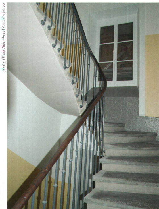
Cage d'escalier après la rénovation, Rue du Tunnel 12