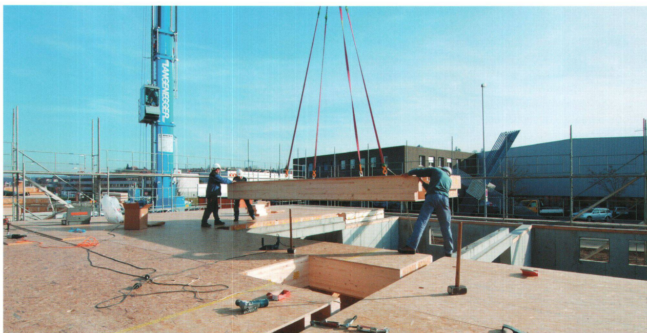
Montage de la dalle du rez-de-chaussée.

Enfin, une récupération de l'eau de pluie pour alimenter les robinets des lave-mains, de la cuisine pour rincer la vaisselle et pour l'arrosage permet de réduire au strict minimum la consommation d'eau potable du réseau. Le résultat se traduit par une économie de 13 millions de litres d'eau potable sur 30 ans, dont 10 millions environ ne seront pas envoyés à la station d'épuration.