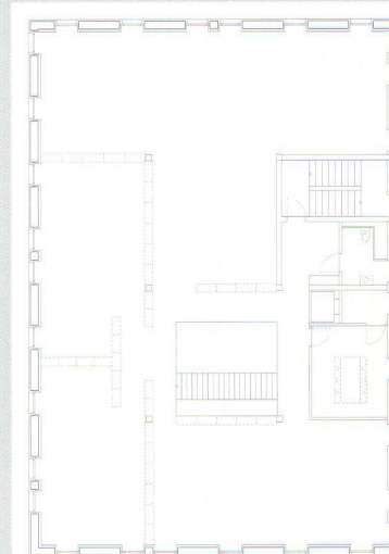
Plan du 2 e étage.