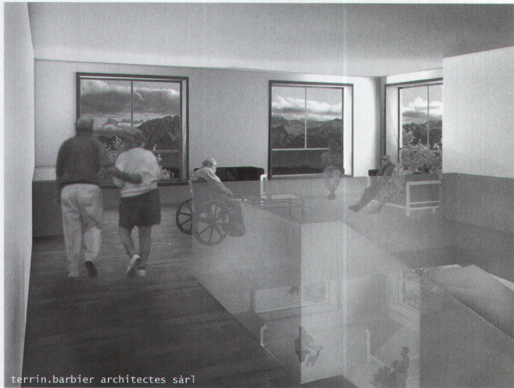
terrain.barbier architectes sàrl

Le salon à l'étage est le lieu de rencontre par excellence.