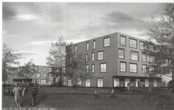
Les deux nouveaux bâtiments, entourés de pelouses et d'arbres.

La portion de terrain sur laquelle doivent s'insérer les logements protégés se situe sur les jardins communaux mis à disposition des habitants de Renens, derrière une