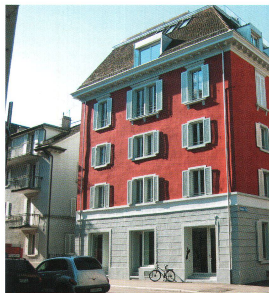
Wogeno Zürich: rénovation d'un immeuble à la Magnusstrasse.

Afin d'augmenter la qualité de vie dans le quartier grevé par le commerce/consommation de drogues et par l'industrie du sexe dans le quartier de l'arrondissement 4 de Zurich, la ville a lancé en 2001 le projet «Langstrasse plus». L'un des quatre piliers de celui-ci est de limiter l'utilisation indésirable d'immeubles, surtout par le milieu. En 2004, la Wogeno Zürich est parvenue à acheter un bâtiment à la Magnusstrasse, une rue parallèle à la Langstrasse, immeuble qui se trouvait dans un très mauvais état. En 2005, la coopérative s'attaque à une transformation globale du bâtiment. La chaleur est fournie par un chauffage à granulés de bois et l'eau chaude est produite par une installation solaire.