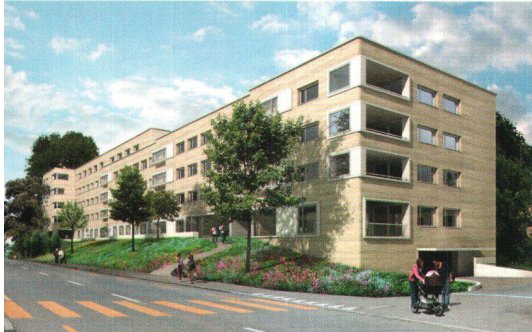
Coopérative Schönheim: construction de 33 logements à Zurich.

trafic routier et aérien à Kloten et y aménage 33 nouveaux logements spacieux. Les nouvelles constructions répondront au standard Minergie, avec aération de confort, chauffage aux granulés de bois/gaz et protection efficace contre le bruit. L'administration a attaché une grande importance au fait que pour tous les locataires actuels, un nouveau logement soit trouvé et elle a pu satisfaire généreusement cette exigence sous de brefs délais de résiliation, des aides au déménagement et autres prestations de soutien. Le Fonds de Solidarité contribue, par un prêt à conditions avantageuses de 990 000 francs, à ce que les nouveaux loyers restent modérés.