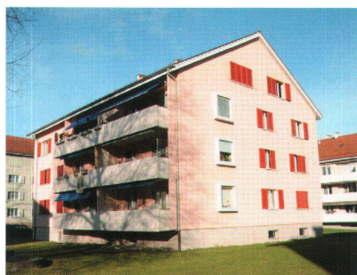
Coopérative Sunnigi Heimet: achat d'un immeuble à Winterthur.

demande, ladite fondation entend élargir l'offre des places et créer des logements supplémentaires avec emplois intégrés pour personnes handicapées. A cette fin, la fondation va acquérir une villa de maître, fort bien située à Zurich, pour la transformer conformément à sa nouvelle affectation. Le Conseil de fondation a soutenu ce projet pour lequel d'autres donations sont également accordées – en partie par des institutions renommées – par un prêt de 240 000 francs.