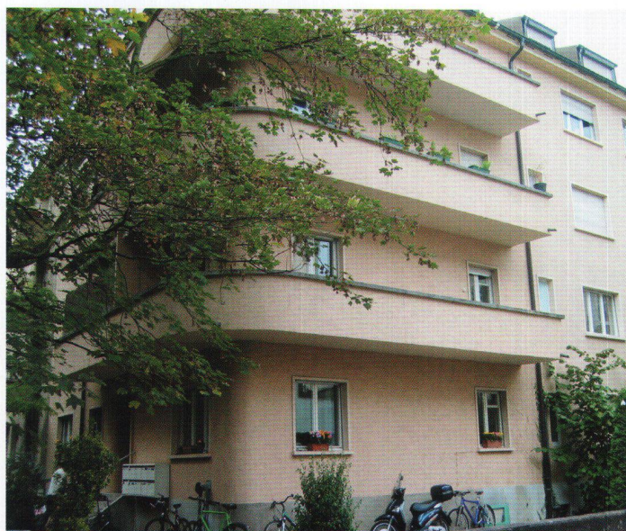
Wohnbaugenossenschaftsverband Nordwest: acquisition d'un immeuble locatif à Bâle.