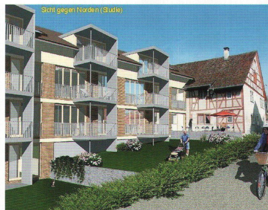
Wohnbaugenossenschaft im gwohnte Dörflingen: création de 11 logements pour personnes âgées.

La récente coopérative Wohnbaugenossenschaft im gwohnte Dörflingen nouvellement fondée a notamment pour but la promotion des intérêts des habitants âgés de la commune, par la construction de logements adaptés pour ceux-ci, avec soutien Spitex étendu. Grâce à l'appui généreux de la commune politique et de certains particuliers, la jeune coopérative peut maintenant réaliser sur un terrain remis en droit de superficie, dans la petite commune schaffouoise de Dörflingen, un premier projet comportant 11 logements. Il s'agit toutefois ici – exigence spéciale posée aux architectes – de conserver l'enveloppe de l'ancienne maison d'habitation avec grange attenante, ce pour des raisons de protection des monuments historiques. Le Fonds de Solidarité a donné son appui à ce projet par un prêt de 330 000 francs.