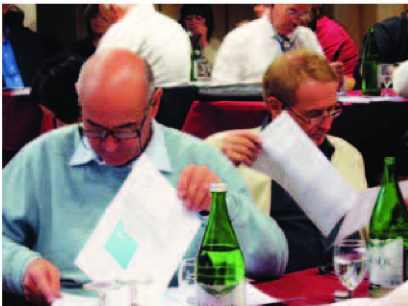
Entre paperasse et discours, il y avait du pain sur la planche...