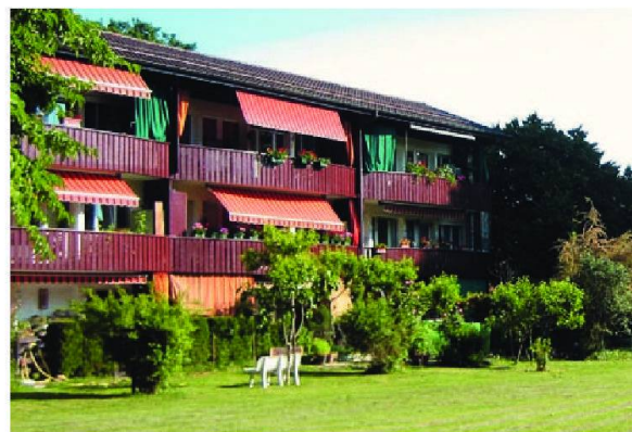
Groupe des immeubles de la route de Malagnou, Chêne-Bougeries, et parc.

Tous les immeubles de la Fondation n'ont pas exactement le même fonctionnement; Cité Vieusseux et Baud-Bovy offrent aux locataires les services de gérants sociaux à plein temps; les locataires de Pré-du-Couvent bénéficient des services d'une personne à la fois concierge et gérante sociale; enfin, les locataires du groupe de Malagnou fonctionnent de manière autogérée: les habitants ont créé une association informelle et ils organisent fêtes et pique-niques à leur guise, sans que le personnel de la Fondation ne soit impliqué. C'est là le fruit d'une volonté ancienne mais toujours d'actualité: offrir aux locataires la plus grande liberté possible, quant aux gérants sociaux, ils ne sont là que pour donner les petits coups de main indispensables et nécessaires au maintien de l'autonomie de chacun.