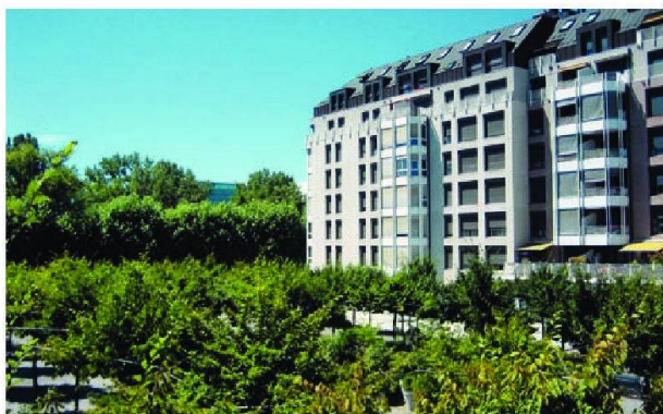
Passage Baud-Bovy, à Plainpalais, et parc public.

Les immeubles comme les logements offrent un confort moderne, pour l'époque: les logements comptent 2 pièces, soit une chambre-séjour et une cuisine, ainsi qu'un cabinet de toilette, le tout sur une surface de 20 m 2 ; les salles de bains et les chambres à lessive, communes, sont aménagées à chaque étage, en bout de course. Les loyers sont de CHF 31.25 ou de CHF 41.25, selon que le