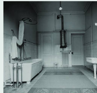
Une salle de bain aménagée dans un immeuble à Zurich en 1826-29.