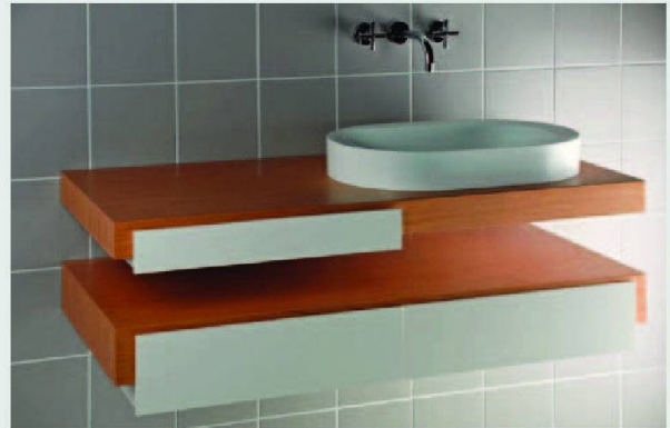
Lavabo au design contemporain, avec le retour du bois.