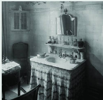
Les soins corporels se sont limités jusque tard dans le XVIII e siècle à un saupoudrage aussi superficiel que parfumé dans la pénombre d'un cabinet de toilette.