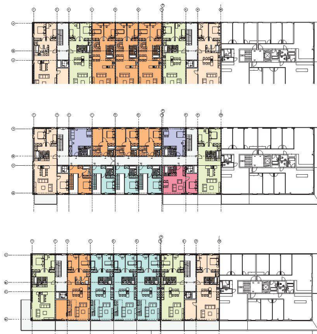
De bas en haut: plan des 1 er et 4 e étages, 2 e et 5 e étages avec rue intérieure, 3 e et 6 e étages.

Texte: Vincent Borcard