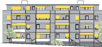
La façade nord après surélévation et isolation en bois.