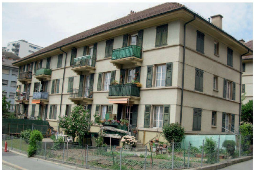
L'une des maisons avant rénovation.

«Parallèlement aux tâches usuelles de renouvellement et d'entretien des bâtiments, nous nous soucions également d'améliorer en permanence les conditions d'habitation de nos locataires, notamment en favorisant ces dernières années les économies d'énergie», raconte l'actuel président de la SCILMO, Christophe Bonnard. Un souci qu'illustre parfaitement le chantier lancé en début d'année à la