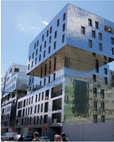
Visite de Lyon-Confluence en vrai.