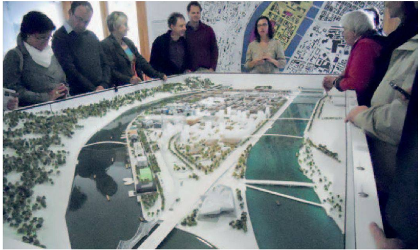
La délégation romande autour de la maquette de l'opération Lyon-Confluence.