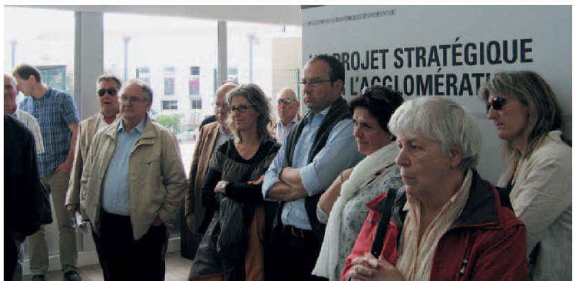
Visite de Lyon-Confluence en vrai.