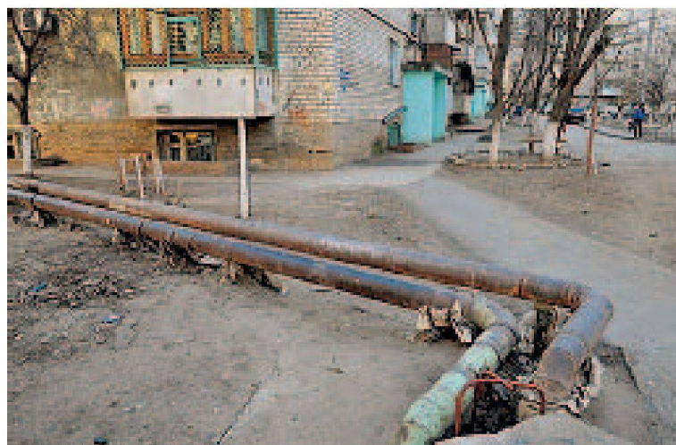
Bon nombre de conduites d'eau chaude agrémentent dangereusement le paysage urbain d'Astrakhan.