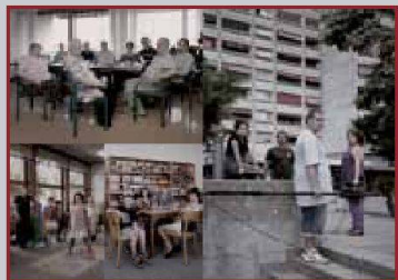
De gauche à droite: Tea time, FLPAl, Genève; Ludothèque La Marelle, Genève; staff de TV Bourdo-Net (www.tvbourdo.net), FLCL, Lausanne.