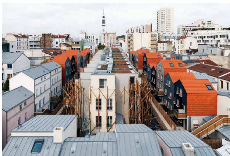
Le lotissement Eden-Bio dans son ensemble, avec les structures en bois qui vont petit à petit se recouvrir de glycines et la grande diversité typologique des petits immeubles.

Une réponse nouvelle et hors du commun à la question du développement urbain, dont l'histoire est marquée par l'échec plus ou moins cuisant des solutions hyper collectives (les barres, les tours), hyper individuelles (les pavillons) et semi-collectives (les maisons urbaines). «A Champigny, ces trois types de réponses au développement urbain se contredisent brutalement et s'entretuent dans une rivalité qui est esthétiquement bruyante et dissonante. La question était donc de savoir comment construire 150 logements et un centre commercial qui ait un sens dans un contexte pareil.»