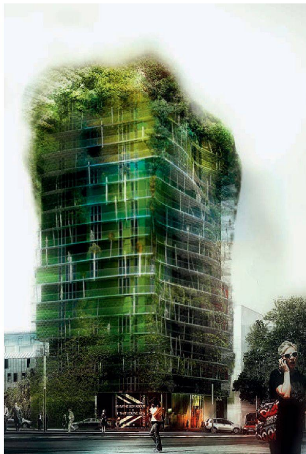
Image de synthèse de la Tour de la biodiversité à Paris. © Maison Edouard François