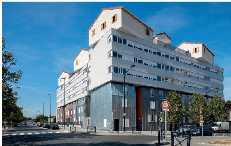
Le collage urbain de trois types d'habitations que l'on retrouve aux environs. De bas en haut: maison urbaine, barre et pavillons.

Pour l'architecte, il s'agit de revenir aux fondements du logement social, à savoir: aider celles et ceux qui travaillent au sein de la ville, mais qui n'ont pas forcément les moyens d'y habiter. Dans ce sens, Edouard François a été amené à dire qu'il fallait supprimer le logement social tel qu'il est pratiqué actuellement. Une position tranchée, mais dont la radicalité se fonde dans une vision plus nuancée de la complexité du milieu urbain que ne semblent l'avoir les élus. Il s'agirait par exemple d'y adjoindre des problématiques connexes, notamment celle du transport, qui est l'une des plus importantes en ville. L'idée consiste alors à corréliser l'aide sociale à la distance au travail: dans un certain périmètre autour du lieu de travail, on toucherait 100% de l'aide, mais plus on s'éloigne du centre de travail, plus l'aide diminue. Une idée qui semble petit à petit faire son chemin dans les voies impénétrables des pouvoirs publics. Pour mieux rentabiliser le logement social, il faudrait aussi le densifier, car à Paris, comme dans d'autres