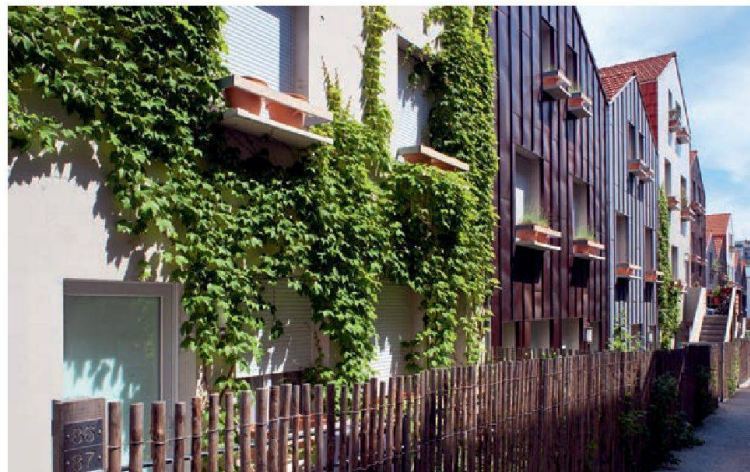
La petite venelle qui circule entre les façades pignons et les grands pots aux fenêtres, que les habitants peuvent utiliser comme bon leur semble.

Le vert des façades joue avec le vert de la végétation, dont la densité croît avec la hauteur: l'effet est obtenu en utilisant du titane oxydé vert. Le titane coûte extrêmement cher, mais c'est un matériau qui est extrêmement recyclable et pour Edouard François, le recyclage est une thématique essentielle, dans un monde qui prend à peine conscience de la limitation naturelle de ses ressources. «Plus les matériaux sont nobles, plus ils sont recyclables