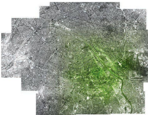
Vue aérienne du cercle de pollinisation estimé dans Paris. © Maison Edouard François

Elevé (pour de vrai) dans des châteaux plantés dans des forêts où l'on ne serait pas étonné de rencontrer Blanche-Neige et les sept nains, Edouard François a noué une relation faite d'émerveillement et de fascination avec la mousse qui tapisse par endroits le sol sylvestre. Une mousse, dont la belle couleur fluorescente est devenue un élément récurrent dans son histoire personnelle d'architecte, d'urbaniste et de designer. Une mousse emblématique qui se conjugue avec d'autres végétaux pour revêtir ses constructions les plus emblématiques de la transition énergétique et sociétale que nous vivons actuellement. PC