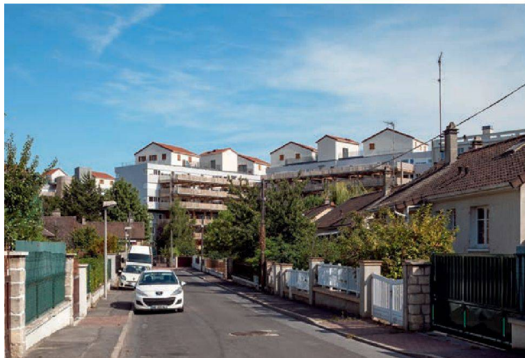
Le dialogue quasi surréaliste entre les pavillons au sommet du collage urbain et les pavillons alentour.