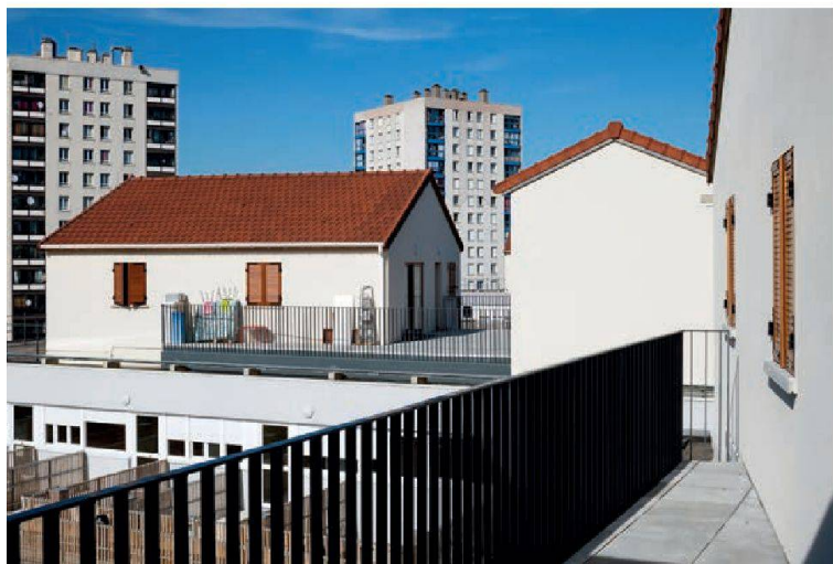
Le dialogue avec la barre, placée en sandwich dans le collage urbain et les tours alentour.