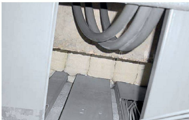
Interdit depuis 1990, l'amiante se trouve encore dans des immeubles construits avant 1990: ici, pour isoler la tuyauterie.