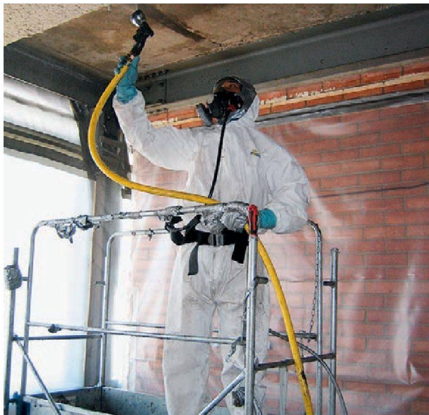
Seule une entreprise spécialisée est habilitée à effectuer des travaux de désamiantage.

demande est restée stable ces dernières années. S'il a eu ces dernières années beaucoup de mandats de diagnostics, il a maintenant davantage de mandats de direction de chantiers et de travaux de désamiantage.