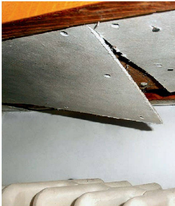
Aujourd'hui encore, dans les immeubles construits avant 1990, l'amiante peut se trouver dans des de nombreux endroits: ici au-dessus d'un radiateur.