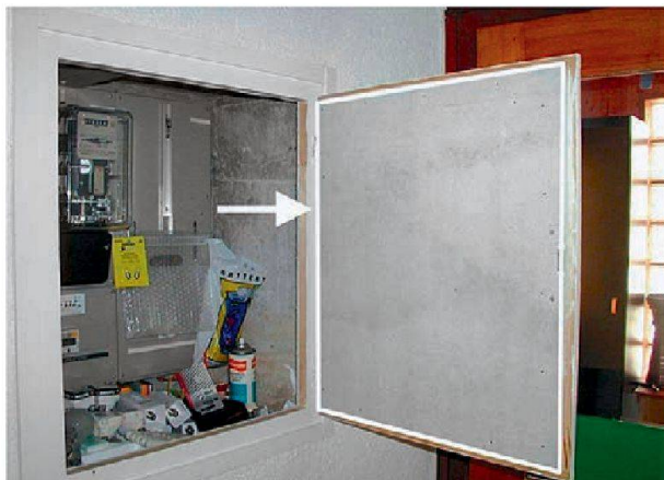
L'amiante permettait notamment d'isoler les portes des tableaux électriques.

la cuisine, remplacement de toute la tuyauterie ou du système de ventilation, etc.) entraîne obligatoirement une analyse officielle sur la présence ou non d'amiante dans la maison. Cependant, un propriétaire peut bien sûr décider de faire un diagnostic amiante de sa propre initiative.