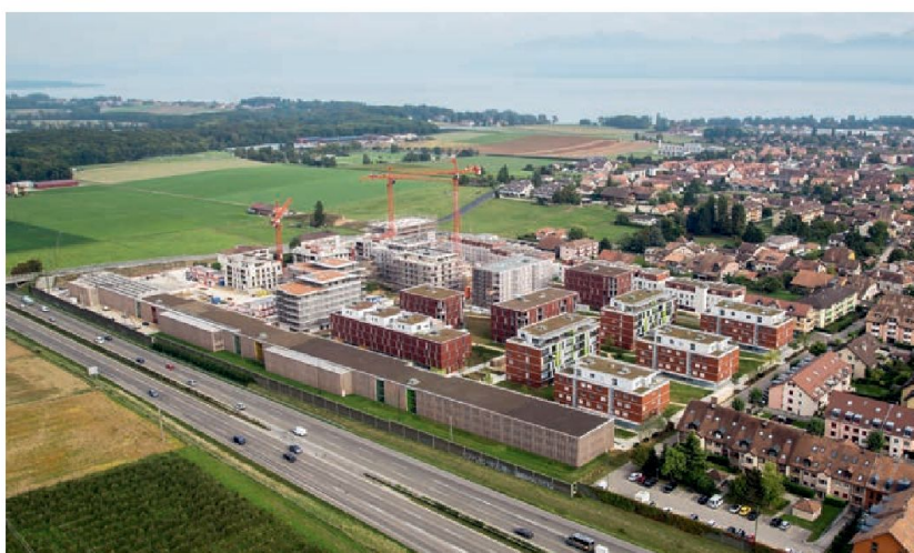
L'écoquartier Eikenott en 2013.

La commune de Gland comptera bientôt 1200 habitants de plus. Ils auront la chance de pouvoir vivre dans le nouvel écoquartier Eikenott: développement durable et qualité de vie en sont les maîtres-mots. Ce projet futuriste est devenu réalité: les premiers habitants viennent d'emménager. Il sera entièrement terminé à la fin de cette année.