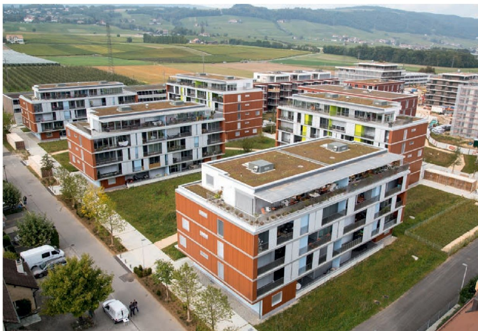
La partie ouest du quartier est déjà achevée.