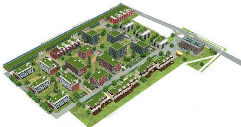
L'axonométrie du quartier en entier.

Pour parler de «quartier durable», il faut pouvoir satisfaire à plusieurs critères. La mobilité douce signifie que les gens peuvent se déplacer à pied ou à vélo (un abri-vélos par bâtiment, 800 places de vélos) et les voitures en sont bannies. Tous les bâtiments ont été labellisés Minergie-Eco: non seulement le standard Minergie est respecté, mais en plus, les matériaux utilisés doivent pouvoir être réutilisables en cas de démolition. Les panneaux solaires qui recouvrent le toit du grand parking extérieur permettent de produire de l'eau chaude sanitaire en été, tout en fournissant aussi une partie de l'électricité nécessaire au fonctionnement de la centrale de chauffage à bois. Ce système de chauffage à distance permet de chauffer tout le quartier. Tout le bois brûlé provient des forêts avoisinantes