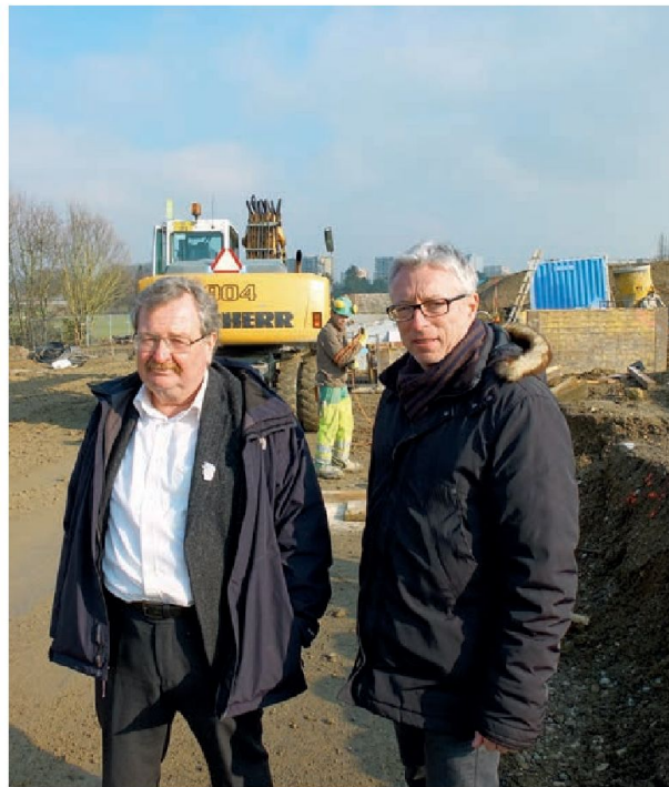
Petit tour sur le chantier.

Comme nous voulons que ce nouveau quartier s'intègre dans la ville existante et aie des liens avec tous les résidents de la commune, il est donc légitime et logique de les impliquer, indépendamment du fait qu'ils iront y vivre ou non.» L'intégration du nouveau quartier passe donc par une bonne anticipation d'un lien avec le reste de la ville, et dans cette optique, les rez-de-chaussée des immeubles des Vergers, dévolus aux activités associatives, artisanales et commerciales, joueront un rôle très important. L'idée étant que ces activités ne répondent pas uniquement aux seules activités d'autosuffisance et de services de proximité du quartier, mais y attirent tous les Meyrinois, histoire de brasser une bonne partie des 22 000 habitants avec les 3000 nouveaux attendus.