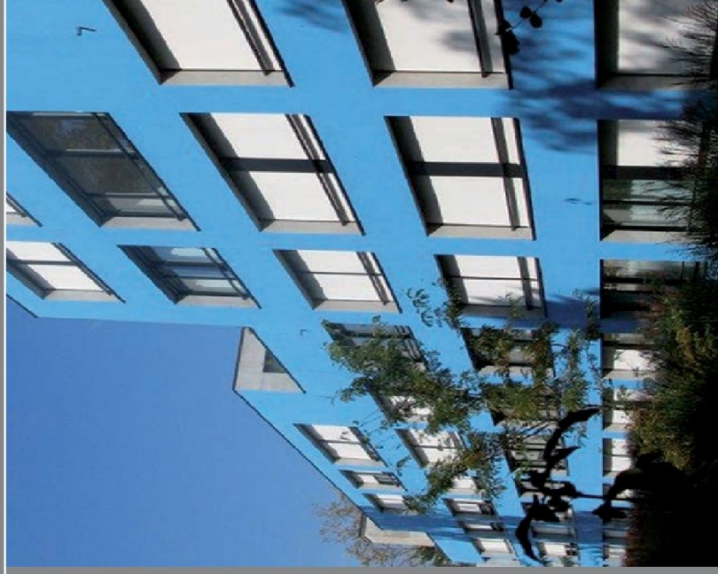
Peinture KEIM après 12 ans