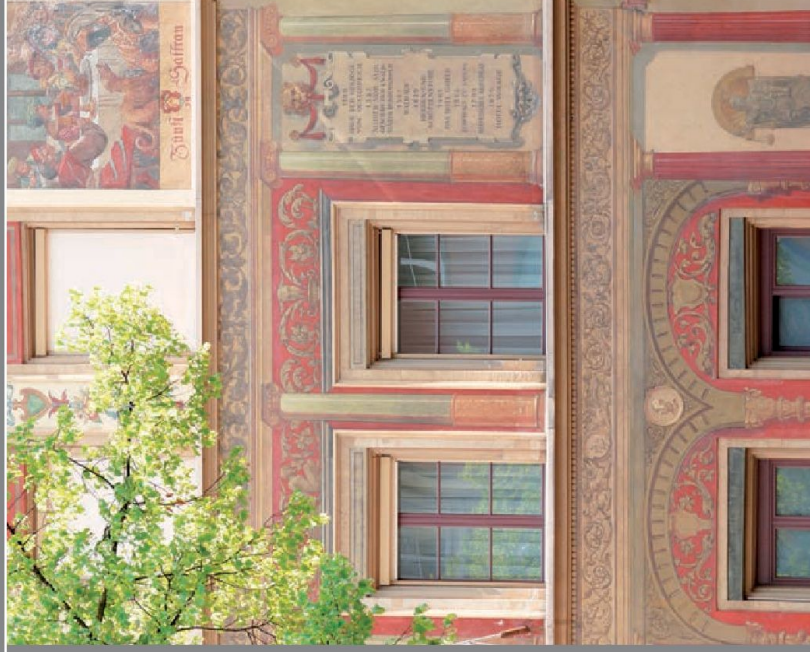
Peinture KEIM après 120 ans