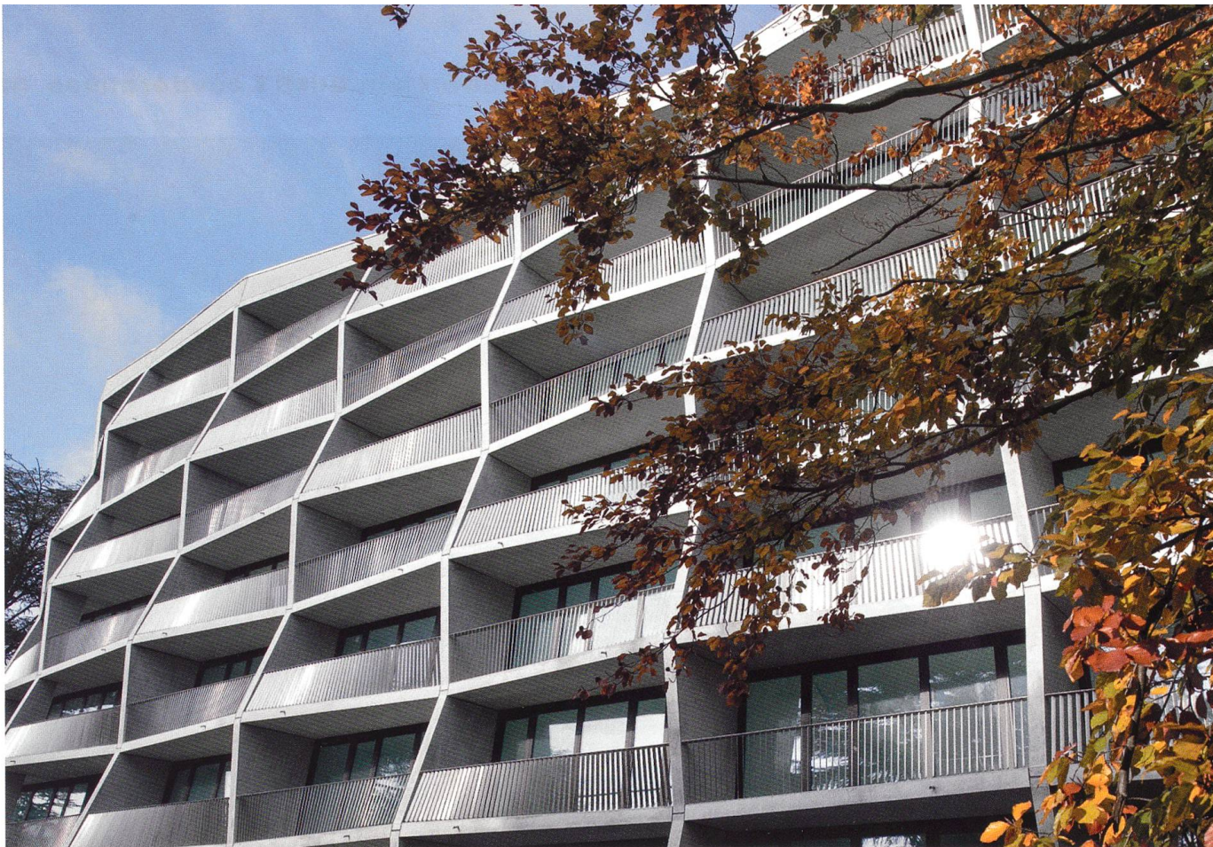
Dans des zones de développement, les villas commencent à céder la place aux immeubles sur des terrains rachetés par des promoteurs ou par l'Etat. La SCHG a achevé cette année un premier bâtiment, avenue de Joli-Mont.

qui n'en était pas à sa première expérience, et Equilibre, qui n'en avait pas encore, mais a fait preuve de beaucoup d'imagination. Aujourd'hui, dans un autre exemple du même type, un terrain au Grand-Lancy a été attribué à la SCHS et l'Habrik, qui entendent favoriser notamment le regroupement de l'habitat et de l'activité économique. Dans le cadre d'une situation aussi particulière, nous avons collaboré, dans le quartier du Pommier au Grand-Saconnex, avec la Codha et Rhône-Arve, avec qui nous partageons même un immeuble. Initialement, le PLQ prévoyait de petits immeubles séparés. Les circonstances nous ont amené à collaborer plus étroitement, et à réaliser in fine les deux premiers bâtiments Minergie Plus du Canton de Genève!