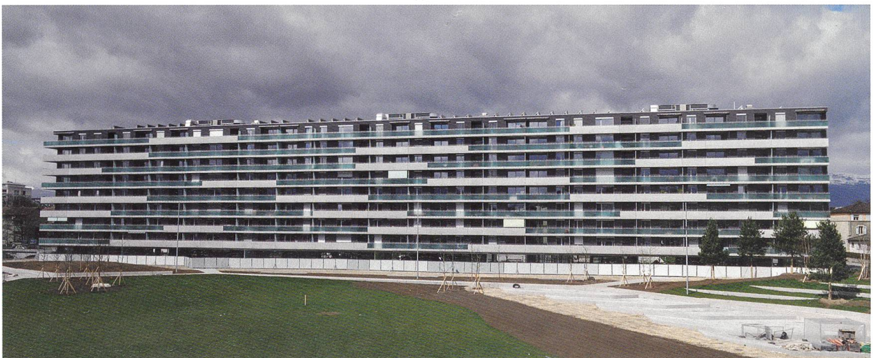
Dans des zones sur le site de l'ancien stade des Charmilles, la SCHG a construit 96 logements. Fruit d'une collaboration avec un promoteur, le bâtiment comprend également des appartements en PPE.

Il y a différents cas. Typiquement, à Cressy, le Groupement avait attribué à trois coopératives les trois objets à construire sur une seule parcelle. Les échanges et contributions ont été fructueux, notamment pour deux d'entre elles, la Société coopérative pour l'habitat social (SCHS)