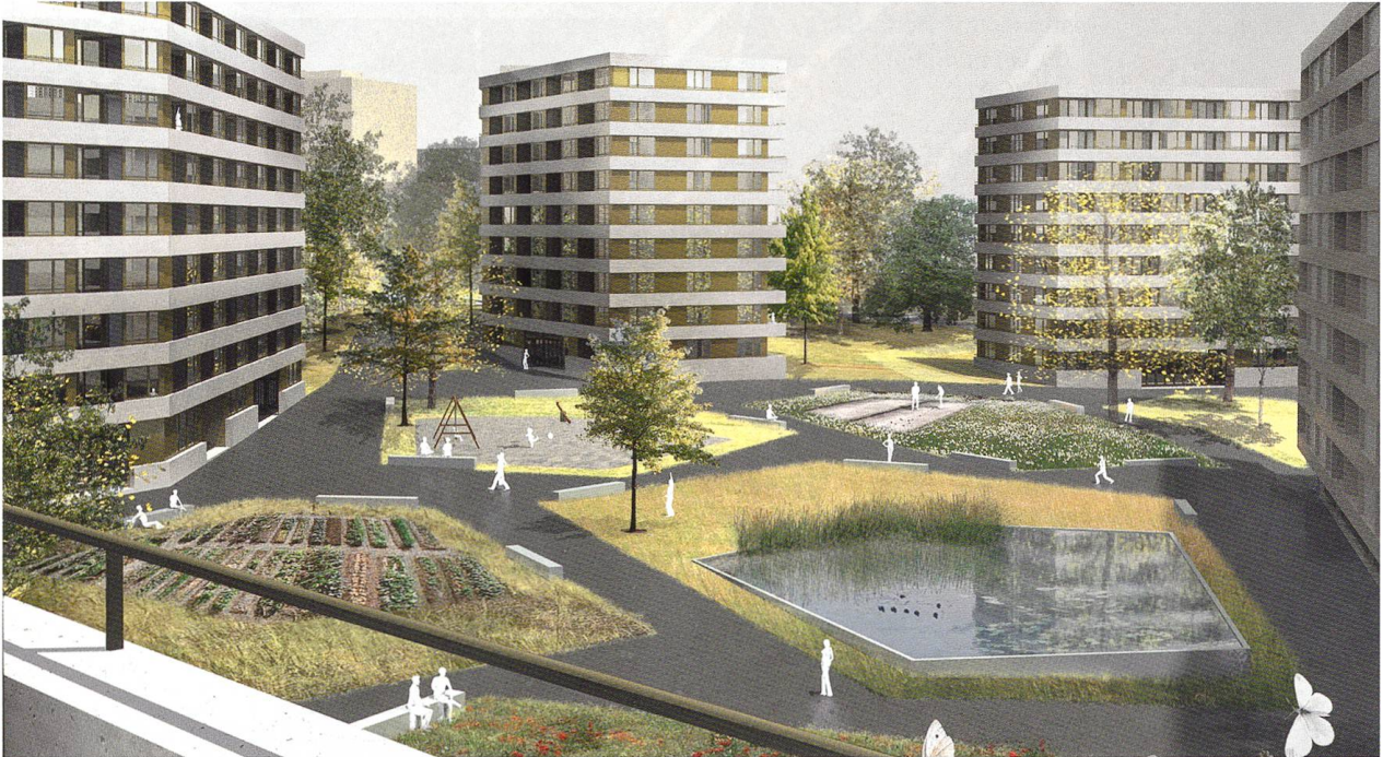
Démarrage en mai-juin d'une réalisation de 63 logements, préambule à la réalisation du projet Papillon (550 logements) sur le site emblématique de la SCHG, près de la Servette. ©Timothée Giorgis Architectes

tiennent à la SCHG et à son partenaire, la Fondation des logements pour personnes âgées ou isolées à Genève (FPLAI). Du côté de la route des Franchises, le projet fait face à un parc colonisé par les écureuils, du côté de la route de Meyrin, à des villas situées sur des terrains en zone de développement, en pleine dynamique de construction-reconstruction. Selon le planning défini par les autorités, l'enquête publique du PLQ devait être lancée en juillet 2014, elle ne l'a été qu'en février 2015. C'est d'autant plus regrettable que l'Etat et la Ville sont les premiers à ne pas respecter les délais légaux qu'ils s'imposent.