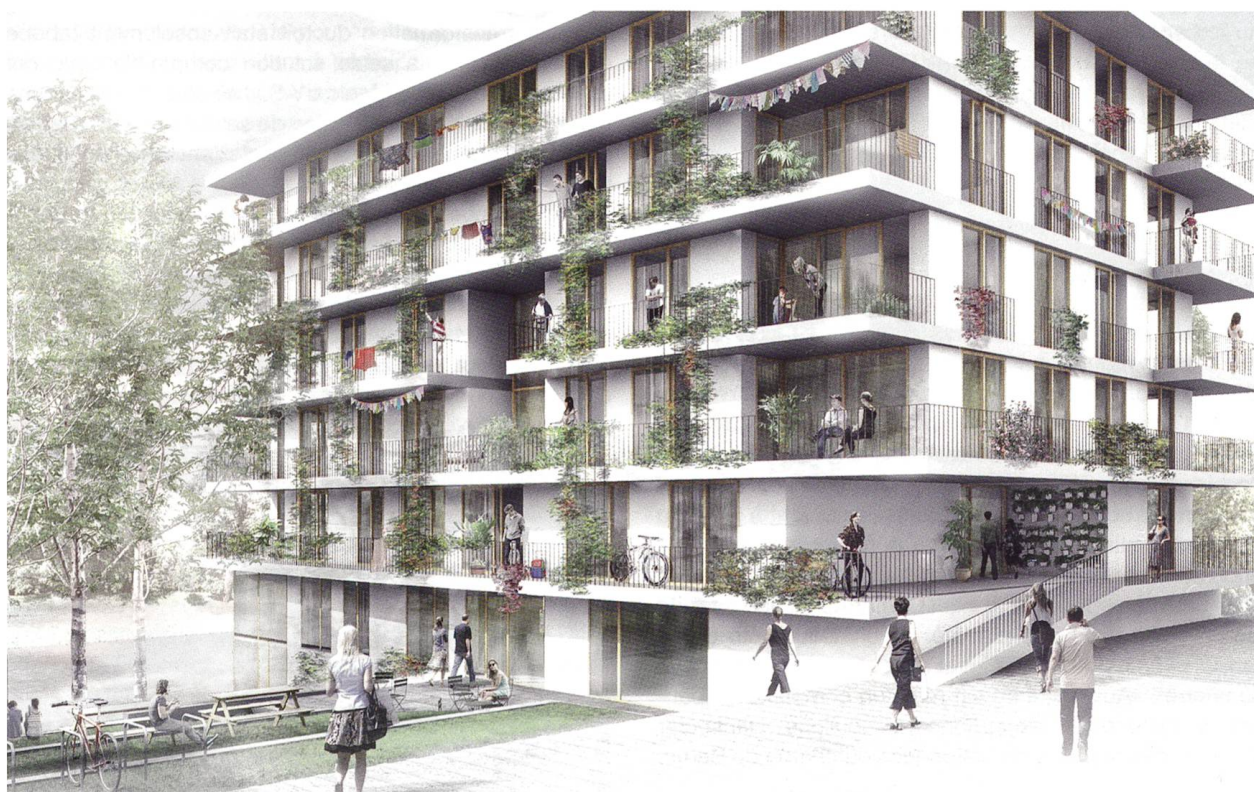
Le Fonds de solidarité a accordé un prêt relais à la Coopérative d'habitation Equilibre qui prévoit, sur trois parcelles, trois bâtiments de cinq étages abritant au total 71 logements subventionnés, dans l'écoquartier Les Vergers à Meyrin.

Des aides financières spéciales permettent aux coopératives d'habitation de construire du logement à loyer abordable. Ces aides ont été harmonisées entre elles en 2014 moyennant quelques retouches. Il est désormais possible d'utiliser des prêts pour acheter du terrain et les limitations des montants par projet et par maître d'ouvrage tombent.