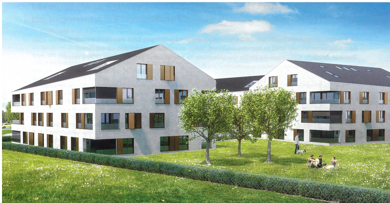
Les immeubles de la commune de Borex